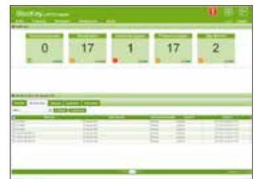
Cuadro de mando del sistema

La tecnología RFID permite realizar el control del inventario en tiempo real sin necesidad de añadir tareas al personal de enfermería. Permite conocer en todo momento la ubicación de los productos quirúrgicos.