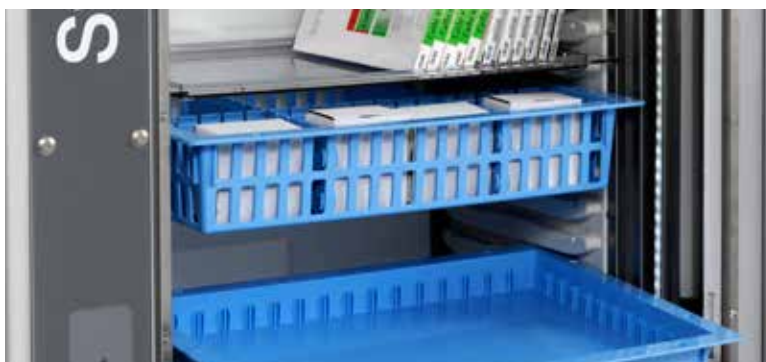
Distribución interior altamente configurable